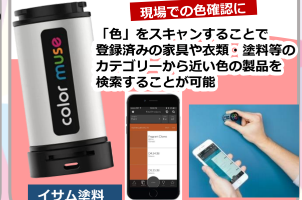
イサム塗料 Color Muse

「色」をスキャンすることで 登録済みの家具や衣類・塗料等の カテゴリーから近い色の製品を 検索することが可能