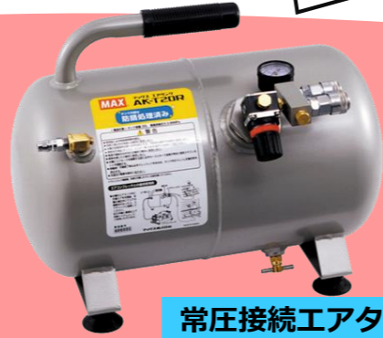
常圧接続エアタンク AK-T20R