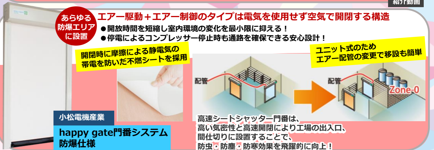
小松電機産業 happy gate門番システム 防爆仕様

高速シートシャッター門番は、 高い気密性と高速開閉により工場の出入口、 間仕切りに設置することで、 防虫・防塵・防寒効果を飛躍的に向上！