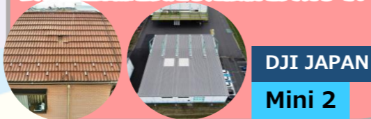
DJI JAPAN Mini 2

重量200g未満の高性能カメラドローン 飛行操作が簡単という特徴を引き継ぎ、 向上した撮影性能とより強力なモーターを搭載。 アップグレードした伝送技術で、 長い伝送距離と安定した接続を実現している。