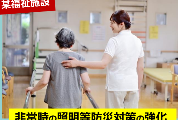
非常時の照明等防災対策の強化

組立・工事不要！ コンセントに つなぐだけで すぐに使用可能！ また机の下に収める コンパクトなデザイン！