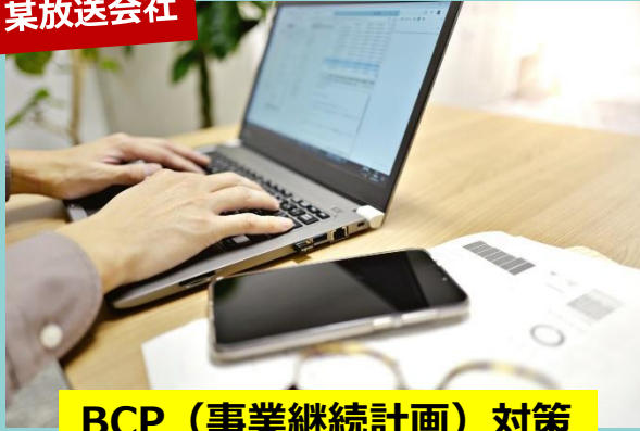
BCP（事業継続計画）対策