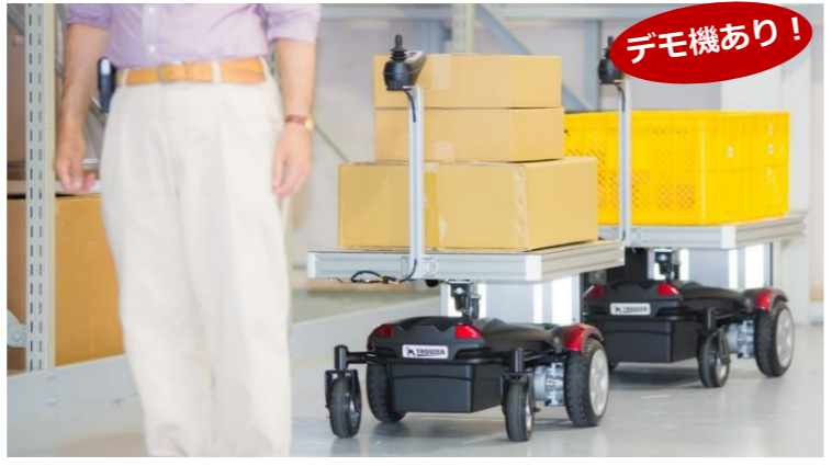
簡単に敷設できる反射テープのラインを検出