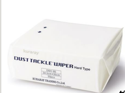
クラレトレーディング ダストタックルワイパー

素材にパルプ繊維とポリプロピレン繊維の混綿の不織布を 採用し、毛羽立ちにくく、水に濡れてゴシゴシ拭いても 破れにくい。 IPA、エタノール、アセトンなどの耐溶剤性にも優れている！