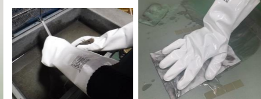
ダイヤゴム 耐溶剤用手袋 ダイロブ5500

強力溶剤に最適！ ほとんどの溶剤に溶けることがなく使用後の 硬化がない！ 手に張り付きにくいので臭いが出にくく、 手洗いも可！