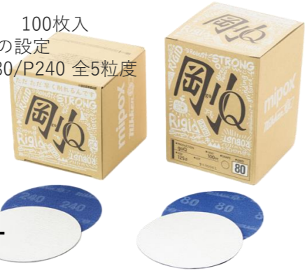
Mipox マジックタックペーパー 剛goQ