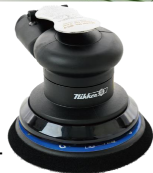
Mipox Go9サンダー ●125φ・非吸塵 D/Aサンダー ●研削力重視オービットダイヤ9mmを採用 ●ワンハンド型、軽量・低重心・低振動で持ち疲れを低減 ●剛goQとの併用で理想的な時間短縮を実現 ●壊れにくく頑丈な仕様