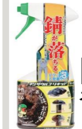
エンジニア ネジザウルス リキッド (泡タイプ)

瞬時にサビと反応し、極小部品で あれば数秒で除錆できる。 中性ですので安全に作業できる (酸、アルカリを含まない)。