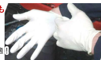
オートビジネス ホワイトラテックスグローブ

薄手のため、細かい作業にも最適！ 溶剤に対して強靭な 耐久性抜群のフィット感！ スマートフォン操作に対応！