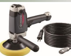
京セラインダストリアルツールズ ポリッシャー (脱着コード)

負荷をかけても回転が落ちないフィードバック 回路搭載。 変速ダイヤル付で適切な回転数を設定できる。 スイッチがONの本体に、通電中の脱着コードを 誤って繋いでも動作しない「再起動防止機能」。 本体を守る、堅牢なダイカスト製プロテクター 操作性の良いロングタイプ補助ハンドル。