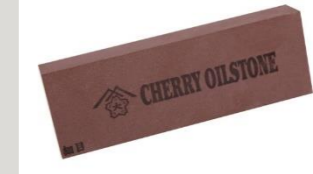
大和製砥所 油砥石 角 A 細目

強靭な材質のA砥粒を主原料として作られている！ 強度があり、使用範囲も広い！ 鉄や鋼など抗張力の高いもののバリ取りや取りシロ の多い粗仕上げに最適！