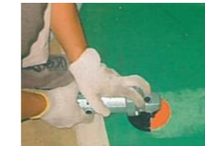
大塚刷毛製造 アートカップ