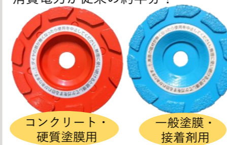
コンクリート・ 硬質塗膜用 一般塗膜・ 接着剤用