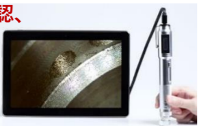
スリーアールソリューション エニティ ハンディ式オート フォーカス顕微鏡

ハンディ型オートフォーカス機能付き のデジタル顕微鏡。 キズや異物などの観察だけでなく、 同時に大きさも計測でき便利！ フルハイビジョンの高画質、小さい傷も見逃さない。